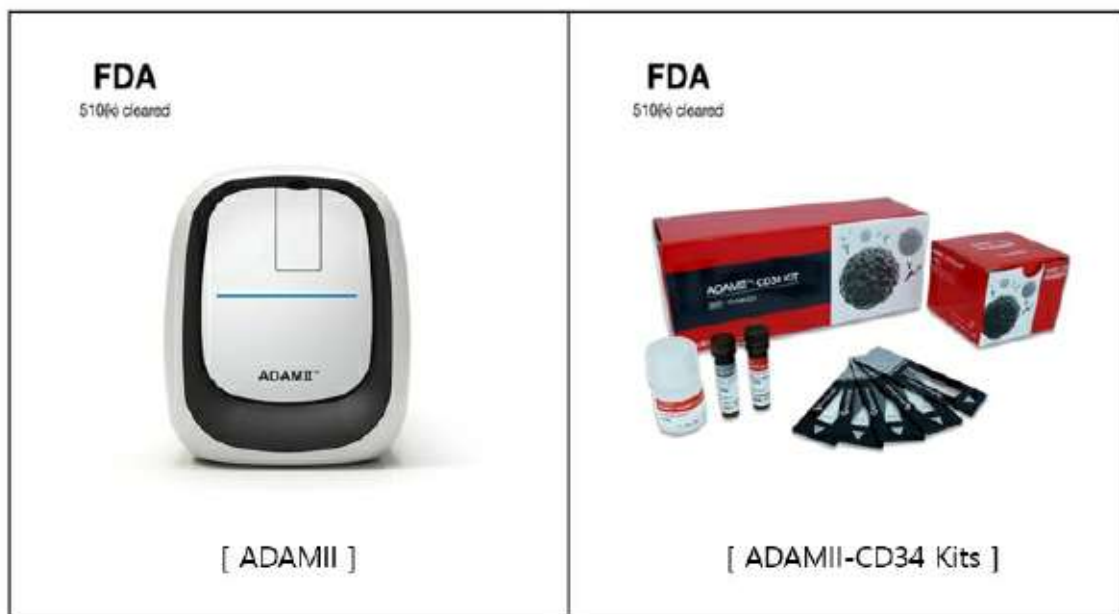
조혈모 줄기세포 자동계수 시스템

ADAMII-CD34 는 백혈구 표면에 존재하는 CD34를 확인하여 CD34양성 백혈구(조혈모 줄기세포) 이식가능 시점 여부를 검정하는 장비입니다. ADAMII-CD34는 백혈구를 대상으로 하며, 형광염료를 이용한 세포 염색 및 세포계수를 실시하여 그 결과를 그래프화하고 데이터를 저장하는 일련의 반복적인 과정을 간편하게 수행 할 수 있다. 그러므로 ADAMII-CD34는 이식 성공률을 높이기 위해 혈액 내에 조혈모 줄기세포의 양을 측정하여 줄기세포 이식 적정시점을 선정할 수 있는 데이터를 획득할 수 있습니다. 또한 ADAMII-CD34에 사용되는 일회용 micro-channel chip의 사용은 매뉴얼 측정에 사용되는 혈구계산판(Nageotte Counting Chamber)를 씻어 재 사용하는 번거로움을 없애고, 보다 빠르고 간편하게 CD34양성 백혈구(조혈모 줄기세포)를