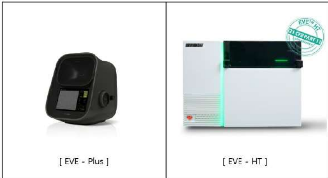
자동 세포 계수기 / 자동 멀티 세포 계수기

ADAM-MC는 형광 물질과 형광현미경의 원리를 이용하여 세포를 계수하는 기기이기 때문에 기본 구조가 복잡하고 제작비가 고가입니다. 이에 보다 저렴하고 휴대가 용이하며, 형광을 이용하지 않는 간단한 세포 계수기의 개발이 필요하다는 생각에 당사에서는 Countess라는 소형 세포 계수기를 개발하였습니다. Countess는 일반 광학현미경의 원리를 기반으로 한 제품으로 1회용 세포 계수 칩인 C-Chip을 이용하여 간편하게 자동화된 세포의 계수 및 세포의 생존율을 측정 할 수 있으며, 일반 실험실 탁자에 거치할 수 있는 소형의 장비로 세포 실험을 하는 실험실이면 어디든 사용이 가능하다는 장점이 있습니다. 현재는 EVE라는 제품명으로 판매하고 있습니다. 2019년 7월 새롭게 출시한 EVE Plus는 기존 검사시간을 25초에서 1초 이내로 단축하였으며, 특수 알고리즘 적용으로 소형 세포계수기에서 구현하기 힘든 뭉친세포의 카운팅에 최적의 성능을 갖추고 있습니다. 한편, EVE-HT는 자동 멀티 세포 계수기로, 최대 48개의 샘플을 단 3분만에 카운팅 할 수 있는 대용량 세포 계수기 입니다. 또한 전용 소프트웨어는 생성된 데이터의 기록, 보안, 결재를 수행하며 cGMP 시설에 사용하기 위한 전자 기록 및 서명에 관한 규정인 21 CFR Part 11을 준수합니다. CFR Part 11 모드가 활성화되면 어떤 사용자도 데이터를 수정할 수 없으며, 장비 내에서 사용된 기능, 날짜 시간 등 사용자의 모든 작업은 추적 기록됩니다. 또한 생체 인식에 기반한 전자 서명은 다른 사람이 재 사용하거나 활용할 수 없도록 설계 되었습니다.