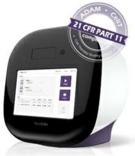
[ ADAM-CellT ]