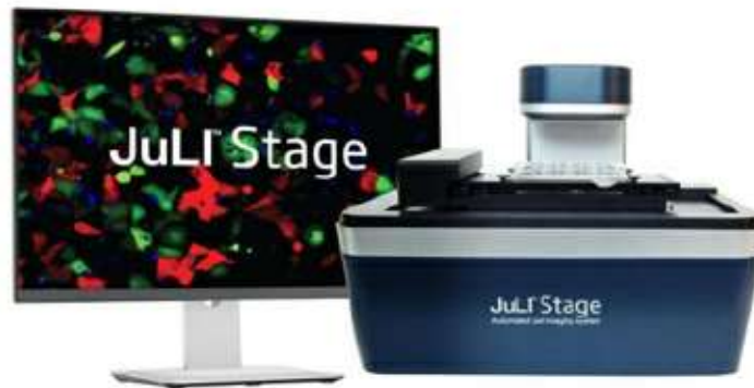
[ JuLi-Stage ]