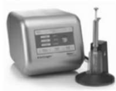
[ Neon ]